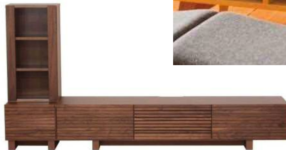
40 キャビネットL + 180 TVボード