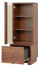
40キャビネットL 内部仕様